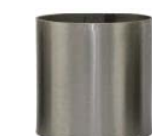
Edelstahl matt stainless steel matt