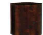
Edelstahl geflammt stainless steel flamed