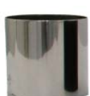
Edelstahl poliert stainless steel polished